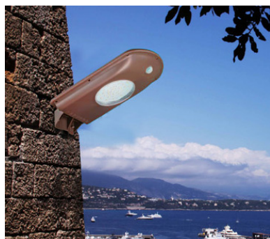
Крепление на стену